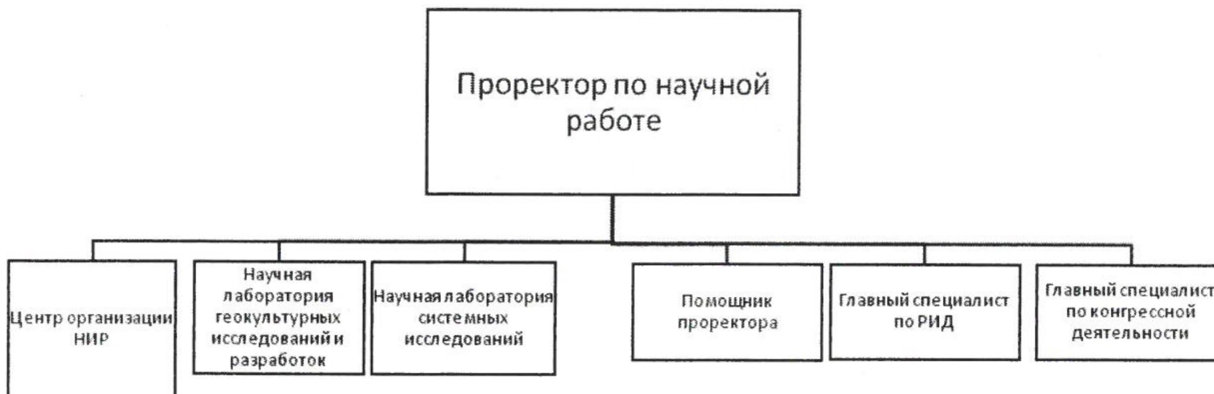
Схема структуры Управления

Приложение 1 к Положению об Управлении по научной работе